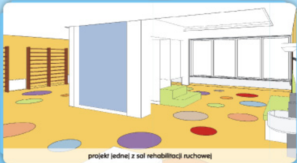
projekt jednej z sal rehabilitacji ruchowej