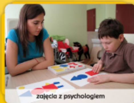
zajęcia z psychologiem