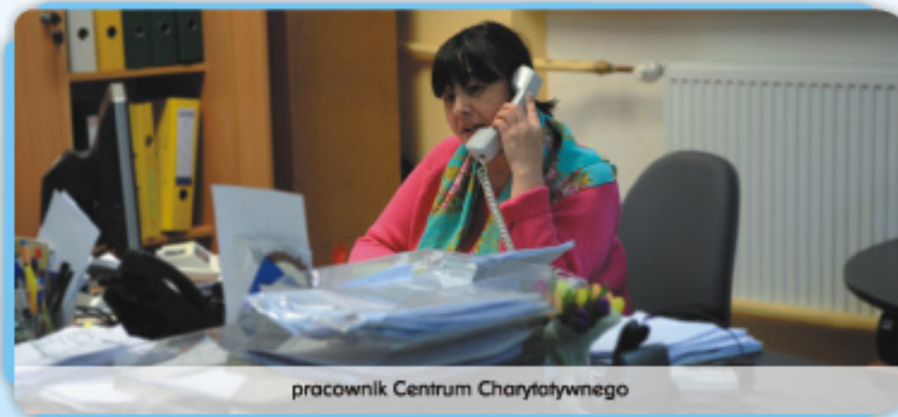
pracownik Centrum Charytatywnego

1% Twojego podatku przeznaczamy na niesienie pomocy chorym i niepełnosprawnym dzieciom.