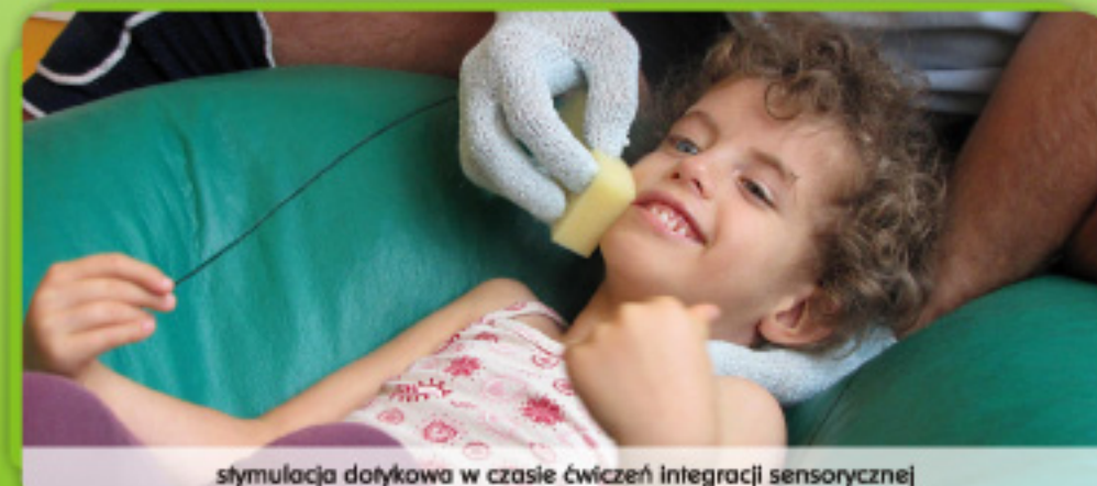
stymulacja dotykowa w czasie ćwiczeń integracji sensorycznej

POMÓŻ NAM POMAGAĆ Podaruj 1% podatku Fundacji Dzieciom „Zdążyć z Pomocą” KRS 0000037904