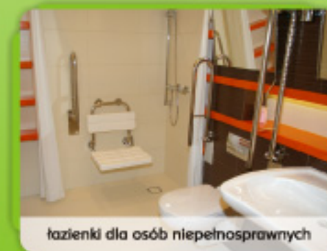
łazienki dla osób niepełnosprawnych