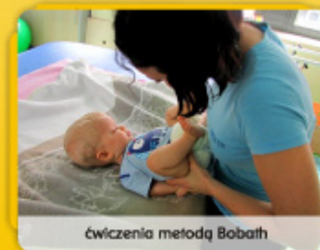
ćwiczenia metodą Bobath