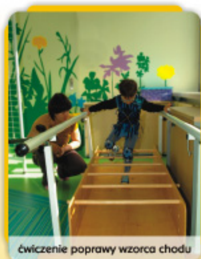
ćwiczenie poprawy wzorca chodu