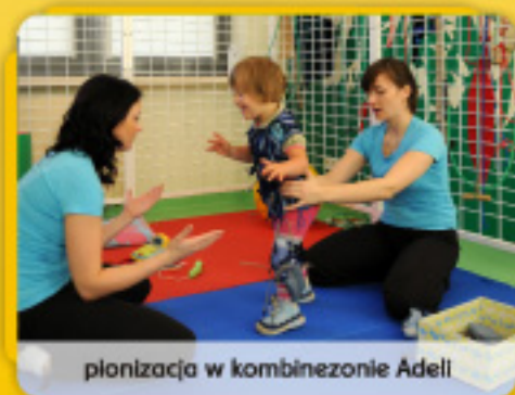
plonizacja w kombinezonie Adell