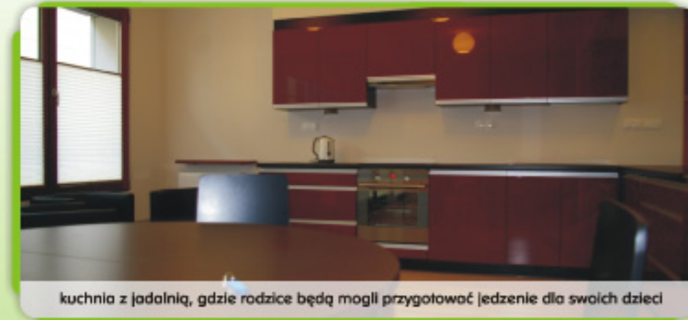
kuchnia z jadalnią, gdzie rodzice będą mogli przygotować jedzenie dla swoich dzieci

1% Twojego podatku pomaga nam prowadzić hostel dla podopiecznych przyjeżdżających na turnusy z całego kraju.