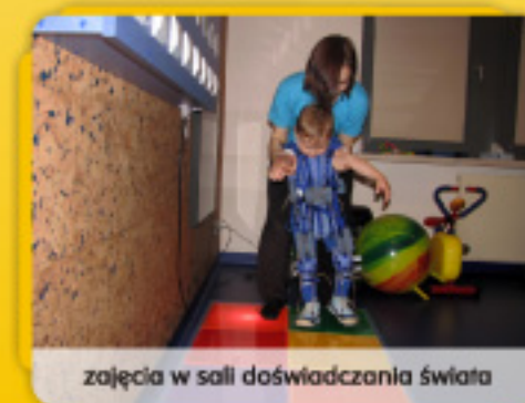
zajęcia w sali doświadczania świata

Oprócz codziennych, indywidualnych zajęć rehabilitacyjnych, organizujemy dwutygodniowe turnusy . Zapotrzebowanie jest ogromne, a kolejka oczekujących pacjentów z dnia na dzień staje się coraz dłuższa.