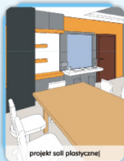
projekt sali plastycznej

Ośrodek będzie znajdował się w Warszawie przy ul. Pańskiej 96. Adaptacja pomieszczeń i wyposażenie ich w specjalistyczny sprzęt rehabilitacyjny to ogromny wysiłek i koszt.