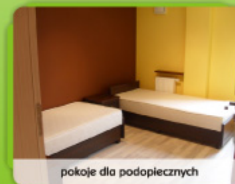
pokoje dla podopiecznych