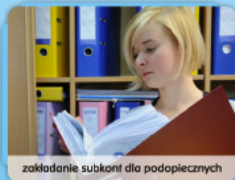
zakładanie subkont dla podopiecznych